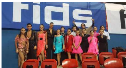
.: La Maestra .: